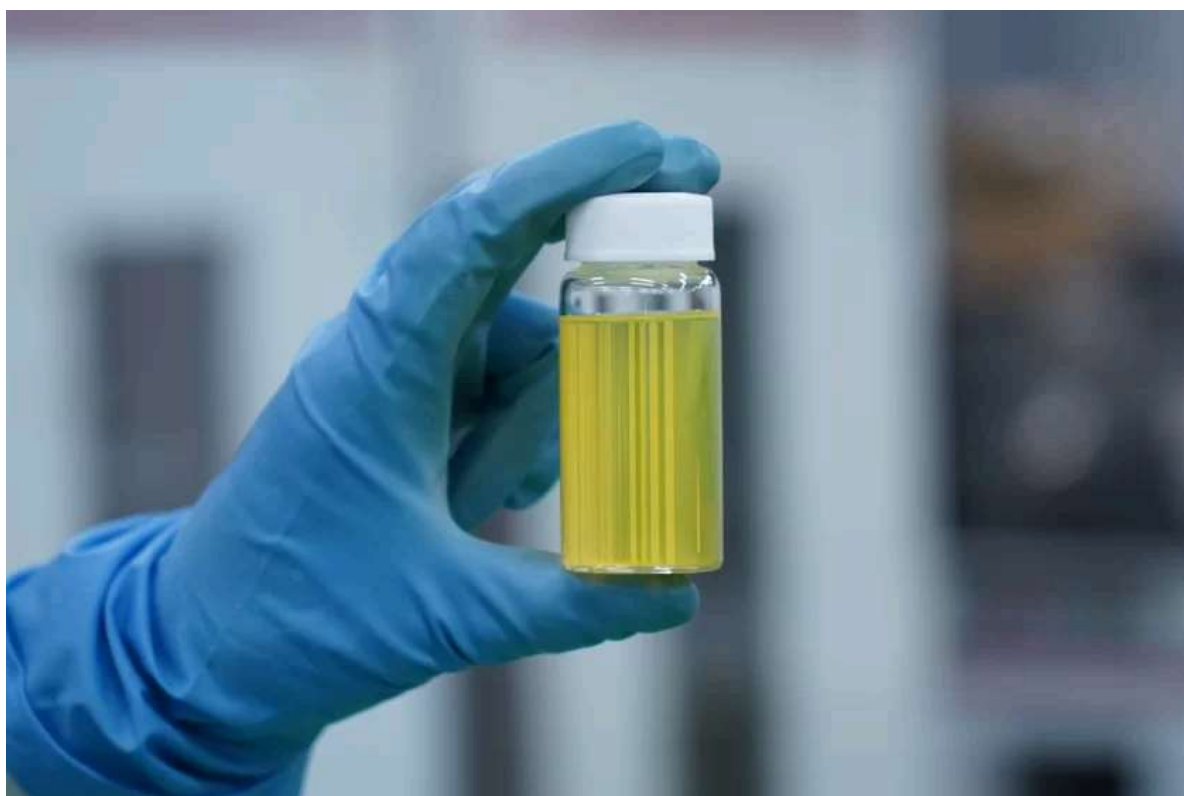
ペルオキシチタン技術を採用

株式会社エコートは、1997年からペルオキシチタン系コーティング剤の事業化に取り組み、1999年に『ミラクルチタン光触媒』シリーズを発売しました。屋外用途向けのミラクルチタン光触媒は、2024年には都心の大型オフィスビル外壁や、改装中の広島駅南口ガラスにも一部採用されています。業界内で長年にわたり培った実績と経験は、現在の製品開発にも大いに活かされています。