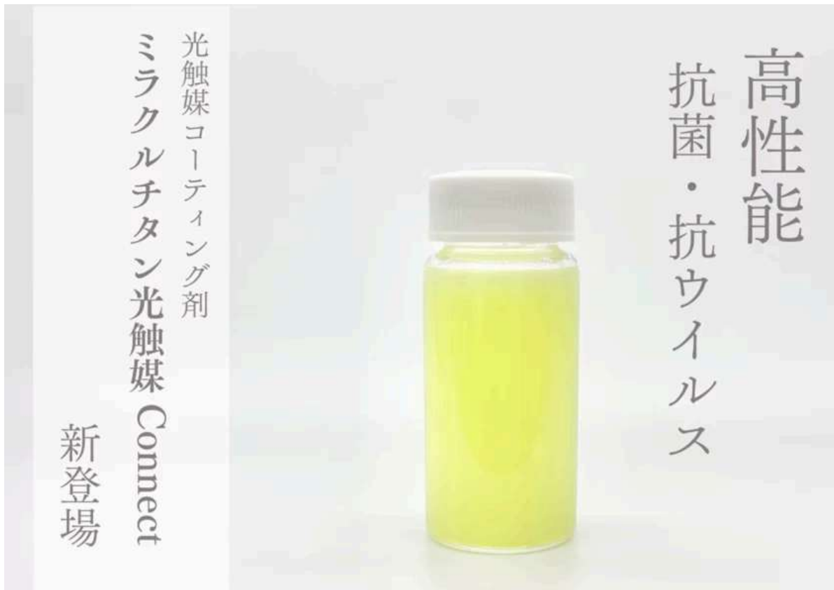
ミラクルチタン光触媒Connect製品画像

株式会社エコート(本社：広島県広島市)は、2025年3月1日(土)より、新製品「ミラクルチタン光触媒Connect」を販売開始いたします。本製品は、抗菌・抗ウイルス性能と環境配慮を両立した完全水系・バインダーレスの光触媒コーティング剤です。